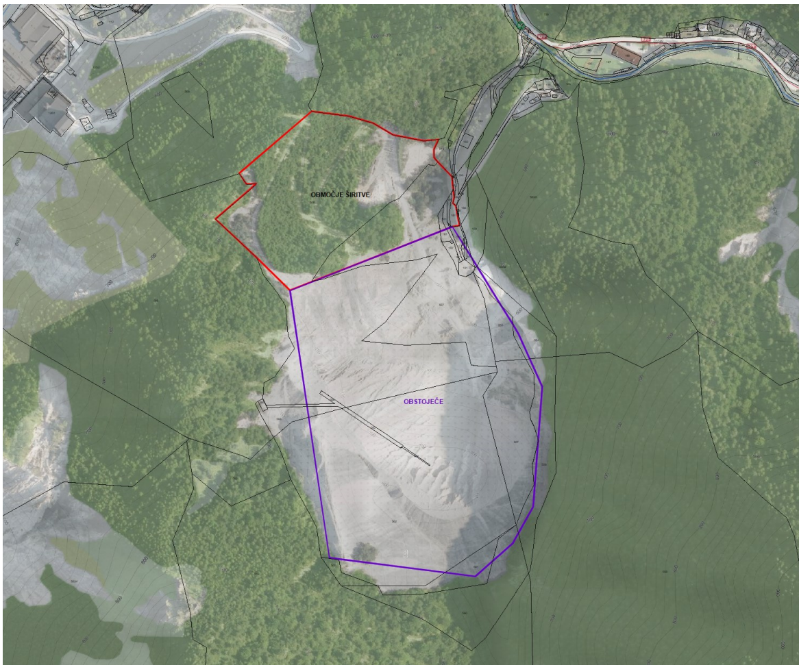
Slika 2: Prikaz območja obstoječega izkoriščanja (označeno z vijolično barvo) in predvidene širitve (označeno z rdečo barvo) (vir: ZKP, DOF; GURS, BergFex: maps.bergfex.at).

Na območju, ki je predmet pobude, želijo podaljšati veljavno koncesijsko pogodbo in dolgoročno zagotoviti možnosti izkoriščanja mineralne surovine s širitvijo proti severozahodu na del območja Žerjav 2, ki je bilo, glede na prvotno plansko določeno območje z namensko rabo prostora LN – površine nadzemnega pridobivalnega prostora po veljavnem občinskem prostorskem načrtu (v nadaljevanju: OPN), bistveno zmanjšano. Širitev pridobivalnega prostora Žerjav (Mežica) v pridobivalni prostor Žerjav 2 (LN, ZR8/2) bo tako potekala s širjenjem izven pridobivalnega prostora Žerjav le na del podenote urejanja prostora ZR8/2 do grebenskega preloma terena na parcele št. 181-del, 567-del in 568-del, vse v katastrski občini 900-Žerjav, v površini približno 4,1 ha (glej sliko 2). Preostalo območje z oznako LN po OPN proti naselju Žerjav ni predmet OPPN. Na teh zemljiščih je predvidena sprememba namenske rabe prostora v primarno rabo ali v zelene površine.