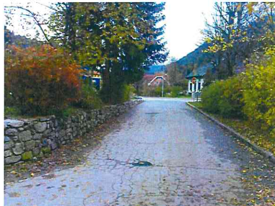
Iztek ulice proti glavni cesti iz Šoštanja (orientacija: levo od potoka)