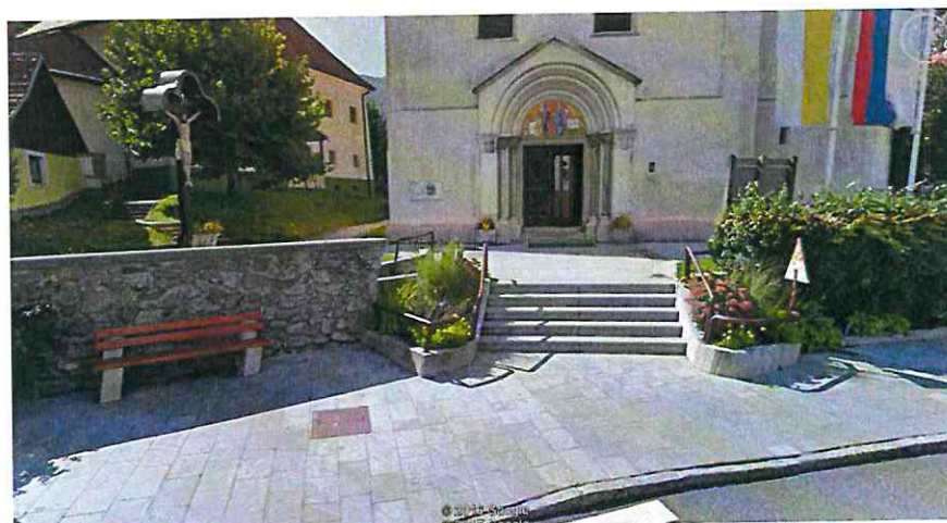
Plošče iz pohorskega tonalita in kocke v ožjem središču - tlakovanje, ki ga uporabimo na ulici ob potoku