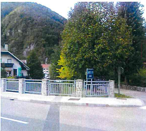
Obraten pogled: začetek ulice kot odcep z glavne ceste (orientacija: modra tabla označuje potok)