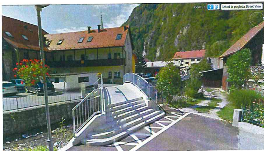
Zaključek ulice pri novjšem mostu - hiše zakrivajo najožje središče kraja