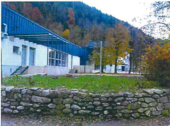
Hotel (dostava in restavracija) in Kulturi dom (orientacija: levo od potoka)

Sike lokacije in na koncu tlakovanja v središču kraja: