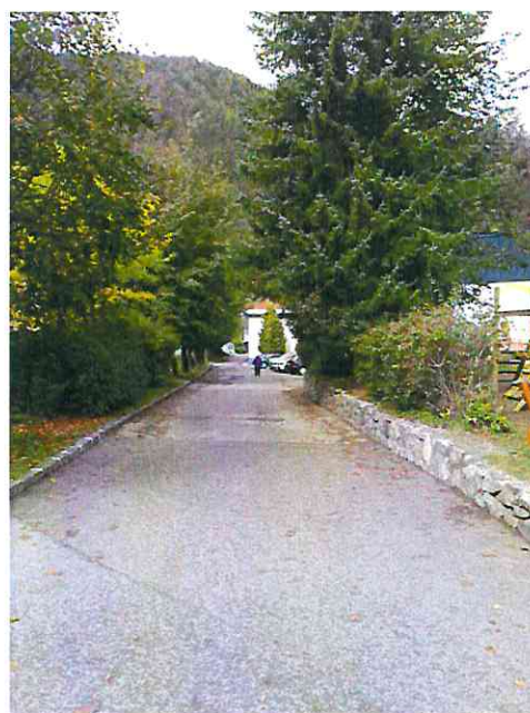
Frontalen pogled v ulico – obraten kot zgoraj (orientacija: desno od potoka)