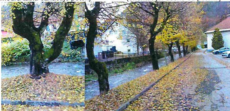
Ista smer pogleda, bolj na polovici ulice kot prejšnja slika